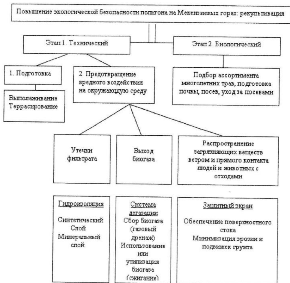
Р и с. 1. Рекомендации по повышению экологической безопасности закрытого полигона на Мекензиевых горах: рекультивация